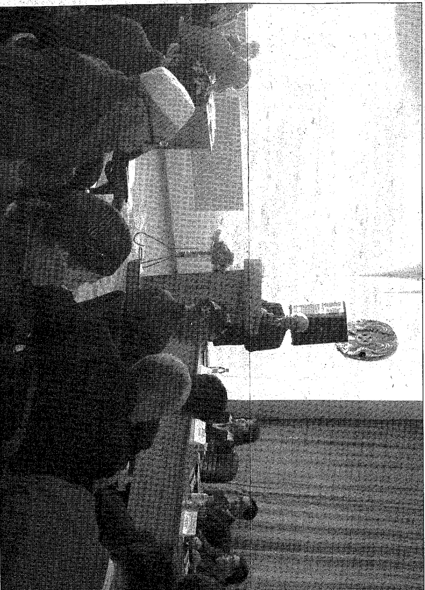
Серьезный разговор: общество слушает недропользователей

ство компании вместе с коренными жителями путем проведения общественных слушаний обсуждают волнующие их проблемы. Это сохранение и поддержка чистоты окружаю-